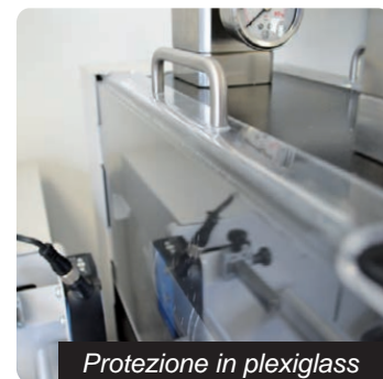
Protezione in plexiglass