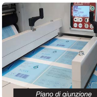
Piano di giunzione

Garantisce il passaggio allineato del materiale all'interno dell'unità durante l'intero processo di lavorazione.