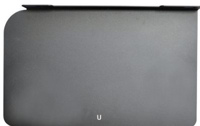
Seconda base svolgitore XL

Produzione roll-to-roll ad alto volume Ideale per la tecnologia Memjet Robusta struttura in acciaio Motori di alta qualità di livello industriale