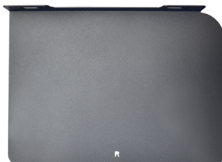
Seconda base avvolgitore XL