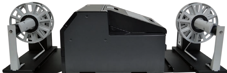
AVVOLGITORE (RW6500A) - EPSON C6500A (stampante non inclusa) - SVOLGITORE (UW6500A)

I nostri svolgitori e avvolgitori appositamente progettati per la stampanti di etichette a colori EPSON C6000A / C6500A sono in grado di gestire rotoli con larghezza fino a 220mm e diametro esterno fino a 250mm. Sia lo svolgitore che l'avvolgitore sono dotati di un mozzo fisso da 3".