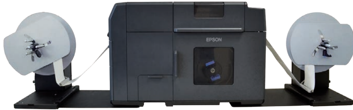
AVVOLGITORE (ASD1111-S0) - EPSON C7500 - SVOLGITORE (ASS1111-S0) (stampante non inclusa)

I nostri svolgitori e avvolgitori per stampanti EPSON C7500 possono gestire etichette di larghezza fino a 127mm, con diametro bobina fino a 250mm.