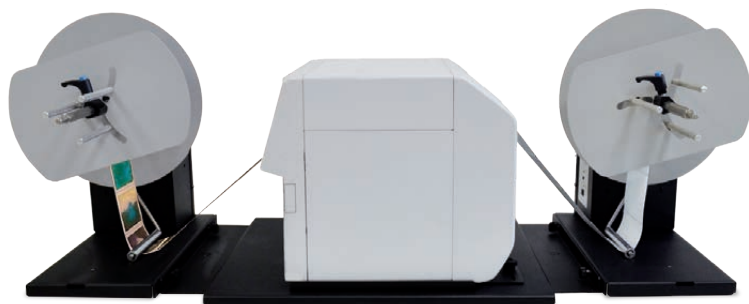
AVVOLGITORE (ASD1111-S0) - EPSON D3800 - SVOLGITORE (ASS1111-S0) (stampante non inclusa)

I nostri svolgitori e avvolgitori per stampanti EPSON D3800 possono gestire etichette di larghezza fino a 127mm, con diametro bobina fino a 250mm. L'utente può scegliere tra due differenti tipi di mozzo: regolabile da 40mm a 118mm o fisso da 76mm (3").