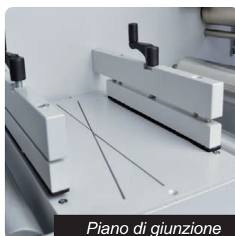
Piano di giunzione